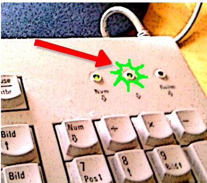
Abbildung 3: Leuchtdiode

Bevor du denkst, du hättest dein Passwort vergessen, schau dir die Leuchtdioden auf deiner Tastatur an.