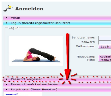
Abbildung 5: Vergessensbalken

Du hast das Passwort von YO erfolgreich vergessen. Das zeigt, dass du auf dem richtigen Weg und du nicht allzu sehr mit materiellen Dingen verhaftet bist. Falls du bereit bist, dich wieder mit überflüssigem Wissen zu belasten, klicke auf den lila Balken „Passwort vergessen“.