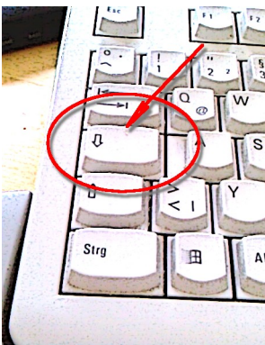
Abbildung 4: Hochstelltaste

Ein gültiges Passwort besteht aus Groß- und Kleinbuchstaben und mindestens einer Ziffer. Alle Zeichen des Passwortes müssen genauso eingegeben werden, wie im Passwort enthalten. Ein großes A muss als „A“ und nicht als „a“ eingegeben werden. Ein kleines b darf nicht als „B“ eingegeben werden. Alles muss so eingegeben werden, wie es im bei YO in der Datenbank hinterlegten Passwort vorgegeben ist.